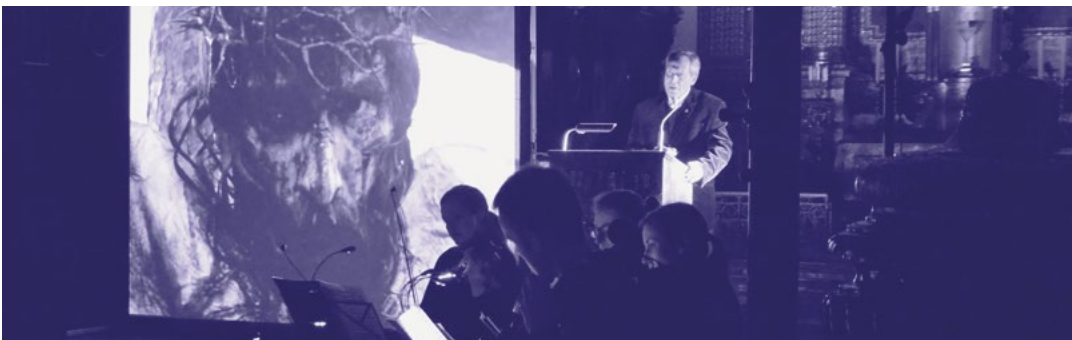
Bazylika św. Krzyża w Warszawie, 02.04.2017