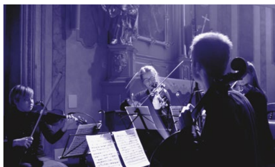
Baltic Neopolis Ensemble, Kościół Parafialny Wniebowzięcia NMP w Kraśniku, 07.04.2017