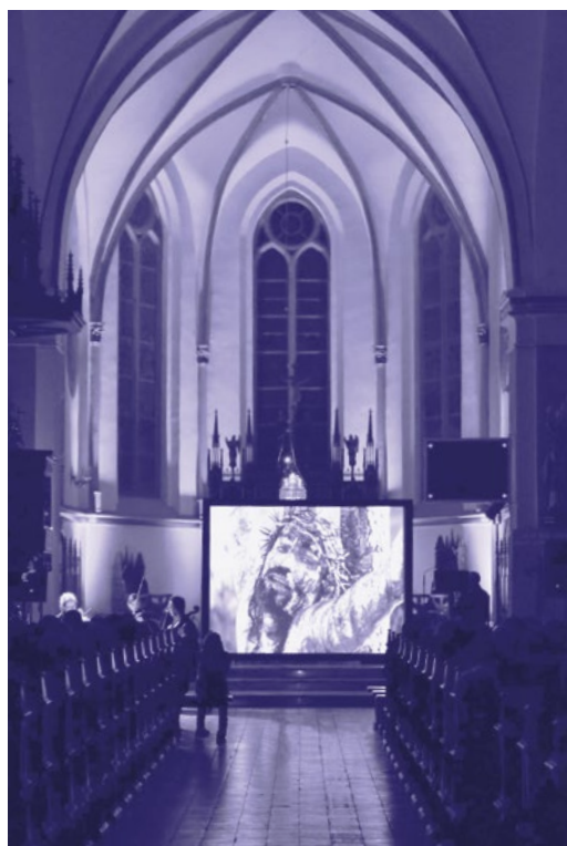
Katedra św. Wojciecha w Elku, 25.03.2017

Klasztor Ojców Bernardynów w Piotrkowie Trybunalskim, Sanktuarium Matki Bożej Piotrkowskiej / 31.03.2017