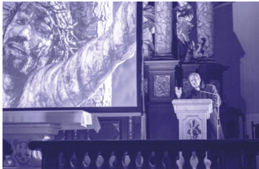
Bazylika św. Jana Apostoła w Oleśnicy, 25.03.2018