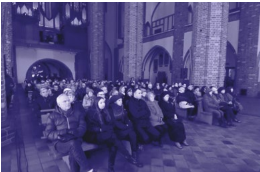
Klasztor Ojców Bernardynów w Szczecinie, 31.03.2017