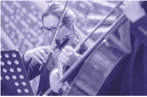
Kościół Matki Bożej Królowej Polski w Zamościu, 10.03.2018