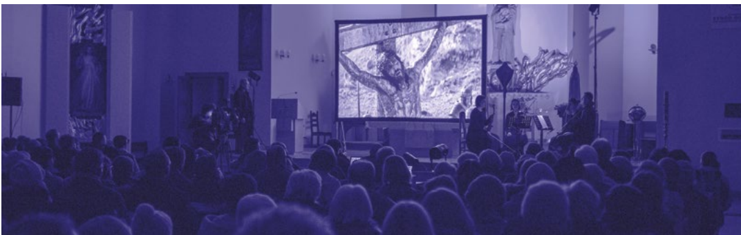
Kościół św. Alberta Chmielowskiego w Zielonej Górze, 23.03.2018