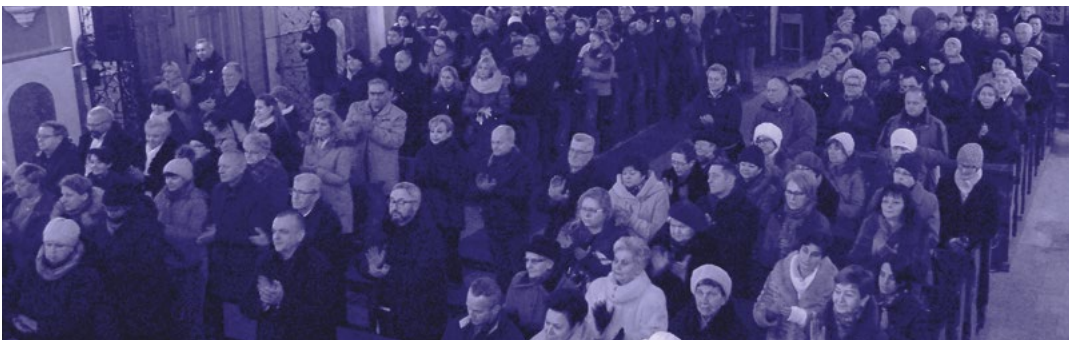
Kościół św. Urbana w Brzeszczach, 04.03.2018

Projekt 14 KATEDR doczekał się dwóch edycji w 2017 i 2018 roku. W związku z dużym zainteresowaniem i bardzo dobrym odbiorem wydarzenia, planujemy zorganizować w okresie Wielkiego Postu 2019, jego kolejną, trzecią odsłonę.