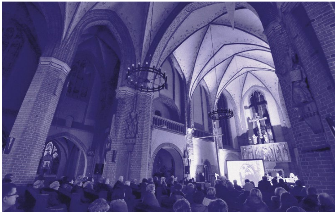
Kościół św. Katarzyny w Goleniowie, 11.03.2017