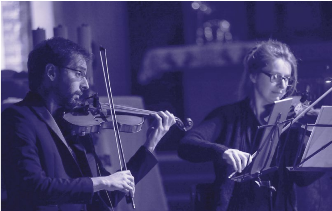
Kościół św. Józefa w Stargardzie, 12.03.2017