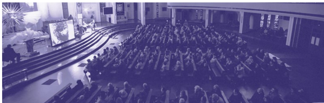
Katedra Najświętszego Serca Pana Jezusa w Rzeszowie, 08.04.2017