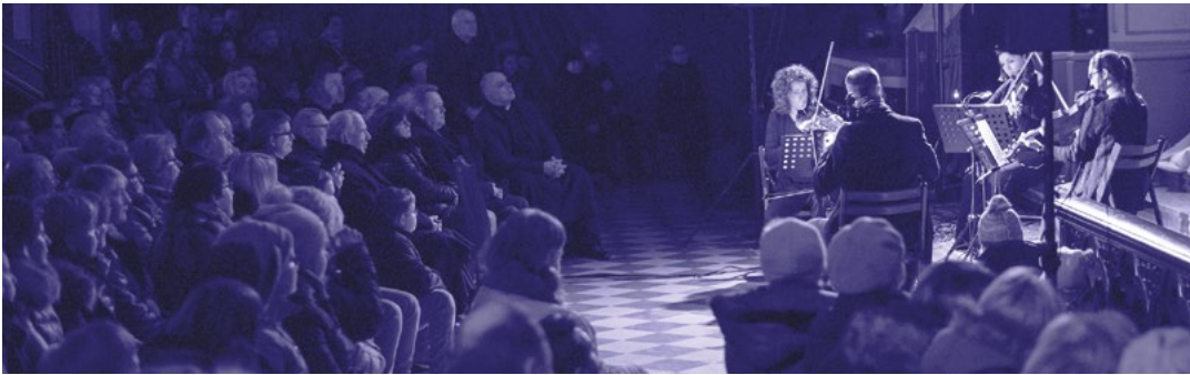
Kościół św. Rodziny w Augustowie, 18.03.2018