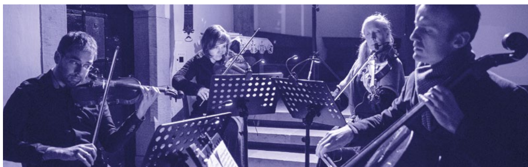
Bazylika Kolegiacka św. Małgorzaty w Nowym Sączu, 24.02.2018