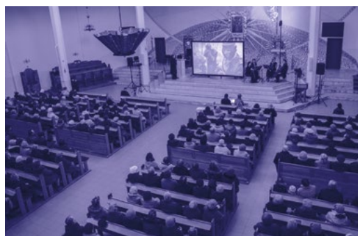
Kościół Matki Bożej Królowej Polski w Zamościu, 10.03.2018