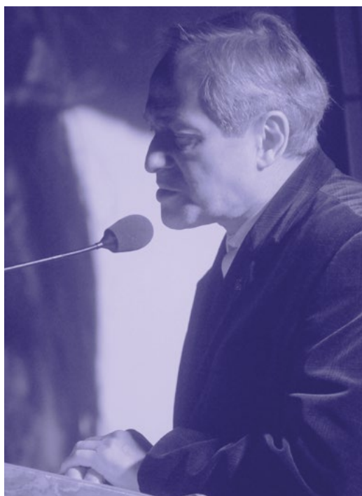
Jerzy Zelnik, Bazylika Katedralna Wniebowzięcia NMP w Płocku, 19.03.2017