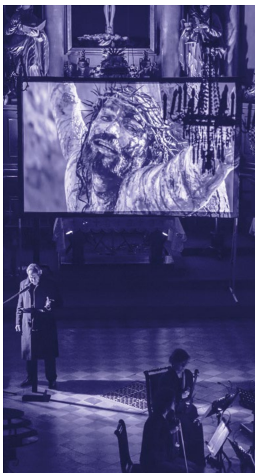
Sanktuarium Matki Bożej Bolesnej w Radomsku, 02.03.2018

NOWY SĄCZ Bazylika Kolegiacka św. Małgorzaty / 24.02. 2018