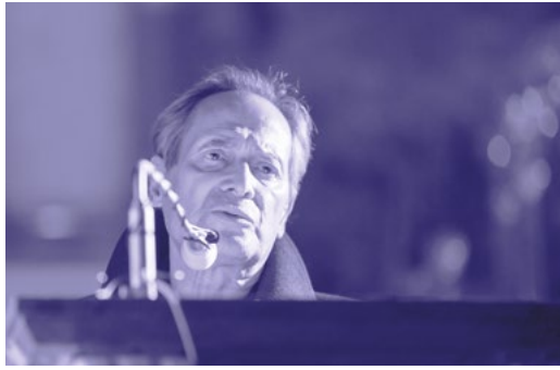
Bazylika Narodzenia NMP w Chelmie, 11.03.2018