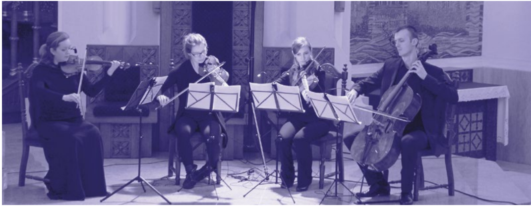
Baltic Neopolis Ensemble, Bazylika Archikatedralna św Rodziny w Częstochowie, 01.04.2017

Baltic Neopolis Ensemble to zespół muzyków - liderów Baltic Neopolis Orchestra (laureat Fryderyka 2015 w kategorii Album Roku Muzyka Kameralna). Baltic Neopolis Orchestra jest orkiestrą kameralną powstałą w 2008 roku z inicjatywy młodych szczecińskich artystów. Ta unikalna w skali kraju inicjatywa szybko zyskała sobie sympatię publiczności oraz pochlebne recenzje krytyków.