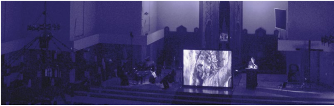
Kościół św. Rodziny w Lublinie, 06.04.2017