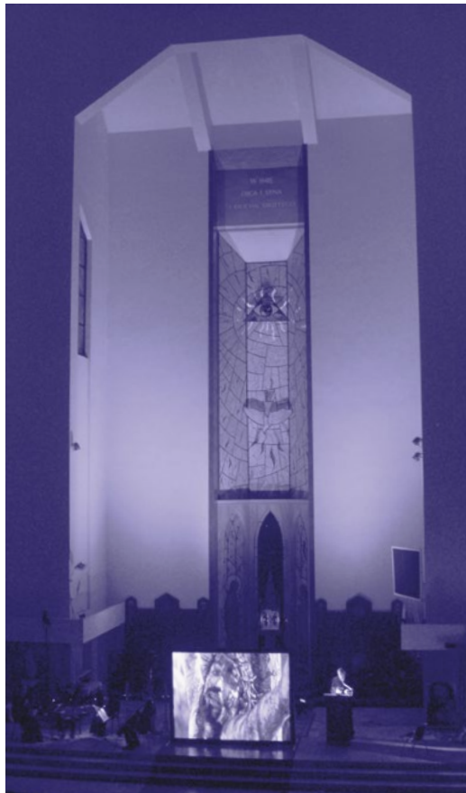
Kościół św. Rodziny w Lublinie, 06.04.2017

Bazylika Katedralna Wniebowzięcia Najświętszej Maryi Panny / 09.04.2017