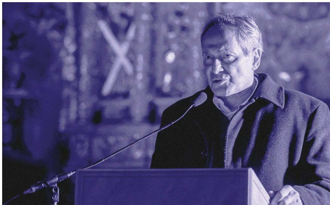
Jerzy Zelnik, Bazylika Katedralna Wniebowzięcia NMP w Pelplinie, 09.04.2017