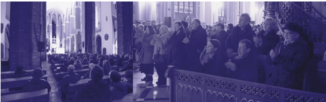
Bazylika Archikatedralna św. Jakuba w Szczecinie, 10.03.2017