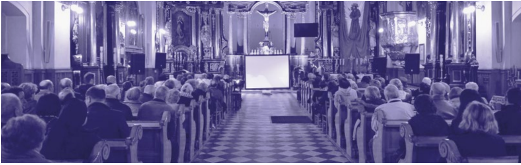
Klasztor Ojców Bernardynów w Piotrkowie Tryb. , 31.03.2017